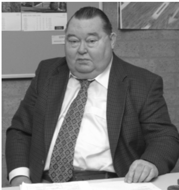
"Het heeft me altijd aangesproken dat de VAWO ook het belang van kwalitatief sterke universiteiten in het oog houdt"

Wiskunde, waar hij bij de leerstoel numerieke wiskunde ging werken en na enige tijd tot wetenschappelijk hoofdmedewerker promoveerde. Hij bleef aan deze faculteit verbonden, later als universitair docent. Sinds 1971 is hij bovendien stagecoördinator van de faculteit en sinds 1981 secretaris van de Centrale Stagecommissie, waarin de stagecoördinatoren van de verschillende faculteiten van de UT samenwerken. Scholten: "We hebben een groot netwerk