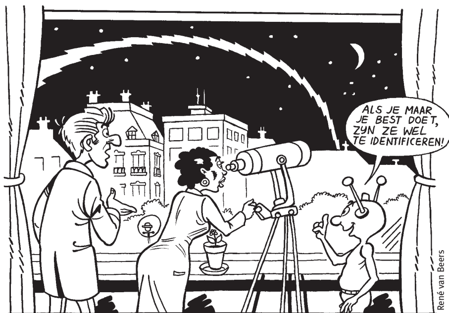
EN...? DE KOMEET VAN HAY... ... MET LOOPBAANKANSEN IN HET KIELZOG

acquisitie contractonderzoek, verantwoording contractonderzoek, en onderzoekswerkgroepen en commissies.