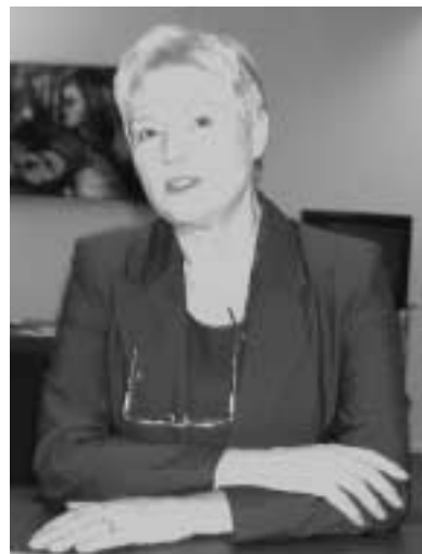
Minister Van der Hoeven in gesprek met VAWO Visie

De VAWO blijft zich inzetten voor de belangen van vaste medewerkers, maar gaat dat meer dan ooit ook doen voor mensen in tijdelijke dienst. Overeenkomst in visie op dit punt is de basis voor de fusie per 1 januari a.s. van VAWO en Landelijk Postdoc Platform. De VAWO streeft voorts naar