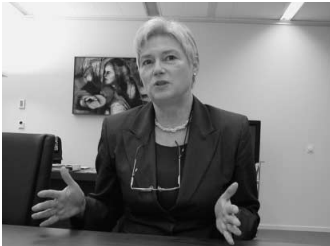
“De autonomie van de universiteiten moeten we handhaven, maar je bent nooit te autonoom om te leren”

overigens niet wil zeggen dat honderd procent van degenen die dat wel doen gehonoreerd wordt; er vindt natuurlijk wel kwaliteitstoetsing en selectie plaats.