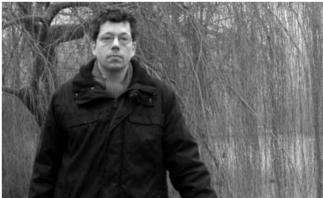
"De vakbonden moeten zich sterker maken voor de tijdelijke werknemers"

Heb jij zoiets wel eens overwogen? "Ik heb ook in Amerika gesolliciteerd. Maar dan nemen ze uiteindelijk liever iemand met college-ervaring aan een Amerikaanse universiteit. Als je ziet wie ze dan aannemen... Die zijn misschien wel capabel, maar echt veel jonger. Ze hebben nog niks gepubliceerd, maar ze zijn teaching assistant geweest. Daar ben ik in Nederland nog niet bang voor, dat ik door de volgende generatie alweer gepasseerd word. Het zou wel een enorme teleurstelling zijn. Stel, ik zeg de wetenschap vaarwel, uiteindelijk. Dan vind ik geen baan op het niveau dat ik zou willen. Ik ben nu 38, het wordt steeds moeilijker het roer om te gooien."