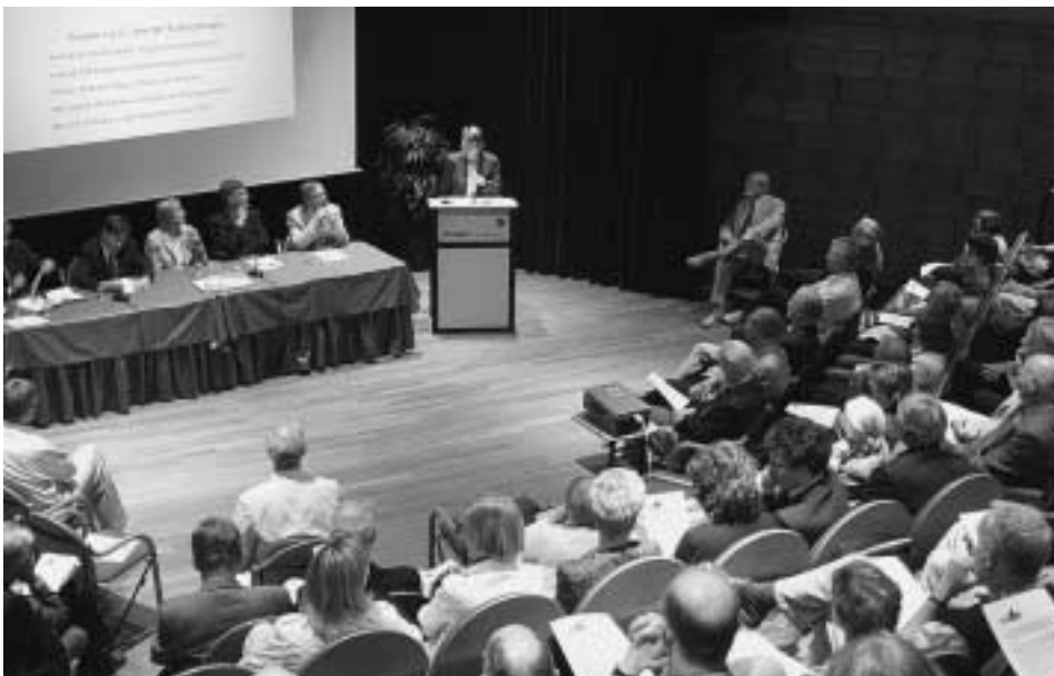
Volle zaal bij het VAWO-symposion op Universiteit Twente. Zie pagina 8 voor het verslag.