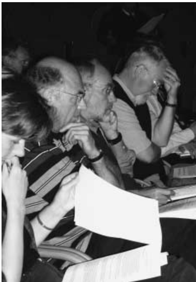
Dubben over de inzet op de kaderbijeenkomst van 18 mei

besloten. Teneinde de gevolgen van de inflatie enigszins te compenseren, is een incidentele eindejaarsuitkering van 1%