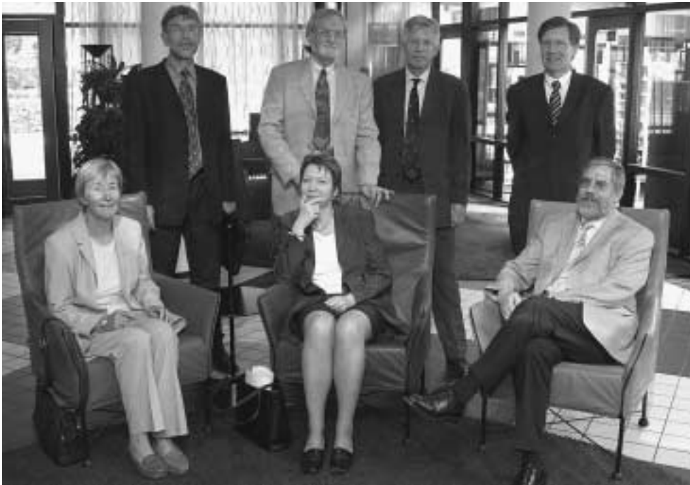
Statieportret van alle hoofdrolspelers

sierd wordt. "Maar de situatie moet zich nog stabiliseren. Dat vergt een jaar of vijf, denk ik."