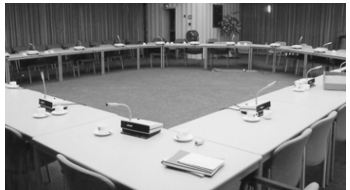
Na afloop van de allerlaatste vergadering van de universiteitsraad aan de UT...

In een op grond van vele gesprekken en stukken goed gedocumenteerd rapport trekt Sorgdrager de conclusie dat het ongedeelde stelsel het best bij de UT past. Tegelijk wordt vastgesteld dat het gekozen stelsel nu ook een behoorlijke groep medestanders heeft. Veel van die medestanders vinden echter de bureaucratische ingewikkeld-