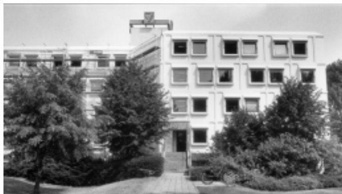
CMHF-pand in Leidschendam

De CAO en andere arbeidsvoorwaardelijke en rechtspositionele zaken komen tot stand in het overleg per overheidssector. Sinds dit jaar hebben de subsectoren universiteiten, hbo-instellingen en onderzoeksinstituten zich ook op het gebied van primaire arbeidsvoorwaarden los geweekt van de sector onderwijs. Per subsector wordt zelfstandig